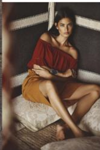
Gewürze stoßen Regenerationsmechanismen in der Haut an, Gold und Baumharze stärken ihren Eigenschutz